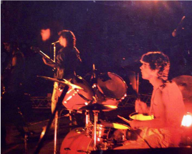
CIELO ACIDO 1986