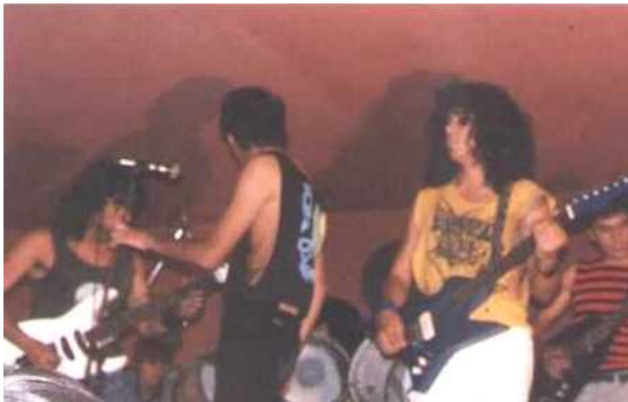
CIELO ACIDO 1987